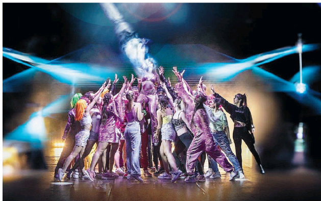
Il 25 e 26 agosto a Locarno un evento ispirato al lungometraggio

Ideato da Meneguzzi, il film coinvolge 30 giovani talenti