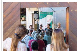
Da giovedì 17 a domenica 20 agosto