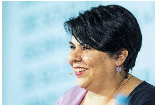
Nel 2015 partecipò alle 37esime Giornate letterarie di Soletta

Circondata dalla sua queer family di dieci persone e dai suoi quattro figli "d'anima" (il più grande di 35 anni, il più piccolo di 20), Murgia ha affrontato le ultime fasi della malattia: "Posso sopportare molto dolore, ma non di non essere presente a me stessa", aveva detto a maggio al 'Corriere', rivelando che, dopo il primo cancro al polmone di anni fa, il tumore era tornato al rene e le metastasi avevano già raggiunto i polmoni, le ossa, il cervello. "Ma non chiamatemi guerriera, odio i militari", aveva avvertito in un affollatissimo incontro pubblico all'ultimo Salone del Libro di Torino. "Se sono stanca di essere antagonista? In un Paese normale, civile, quello che faccio io lo fanno gli intellettuali e nessuno viene trascinato in tri-